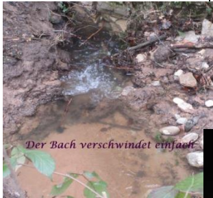
Der Bach verschwindet einfach