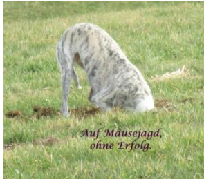
Auf Mäusejagd, ohne Erfolg.