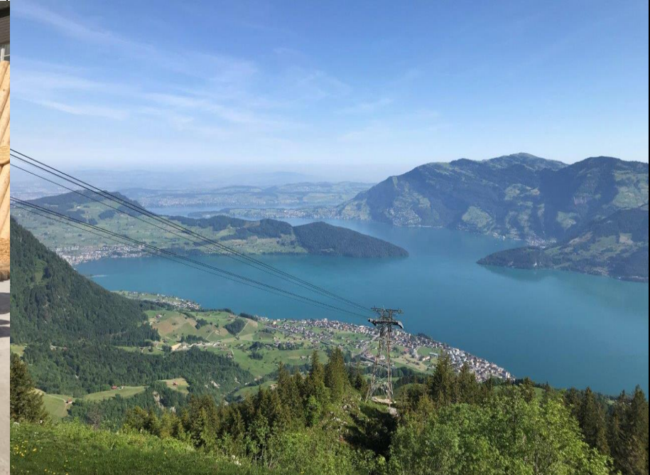
„Wanderung v. 18.06.2019“