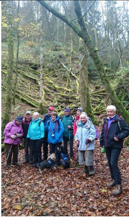
v. „Wanderung v.07.11.2017