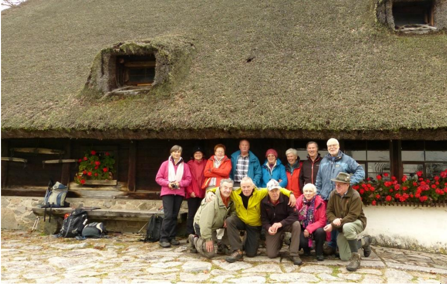
v. „Wanderung v. 09.11.2017“