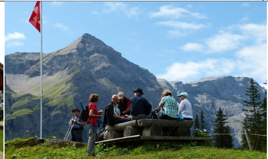
v. „Wanderung v. 22.08.2017“