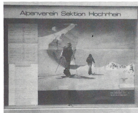
In Wehr an der Talschule Gestaltung: Dieter Endt