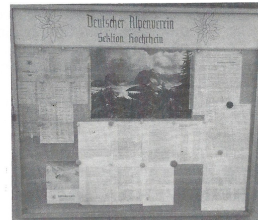
In Bad Säckingen beim Klubheim/Lohgerbe Gestaltung: Robert Schammler