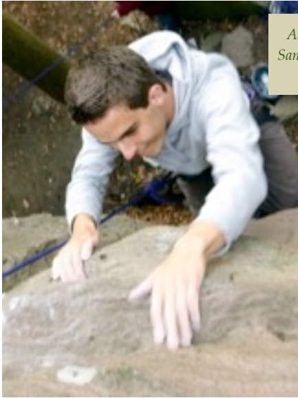
Abwechslung zum Albtal bietet der Sandstein in Gueberschwyr im Elsass für unsere Jugend zu Genüge.

am 12. und 13. Mai in Gueberschwyr im Elsass